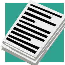
Documenten, zoals de exploitatie die de gerechtsdeurwaarder wilde uitbrengen