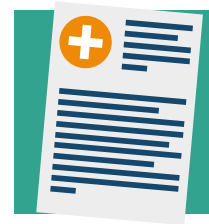
Verklaring deskundige (bijvoorbeeld een arts)