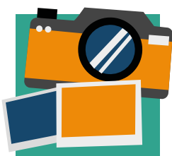
Beeld: foto's of film